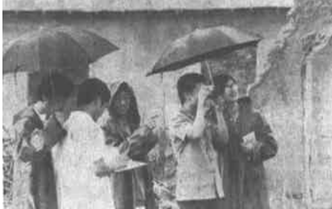
克服了点多面广、交通工具和业务人员严重不足等困难，做到了现场查证及时，理赔迅速，受到保户的高度赞扬。图为他们在现场查证。