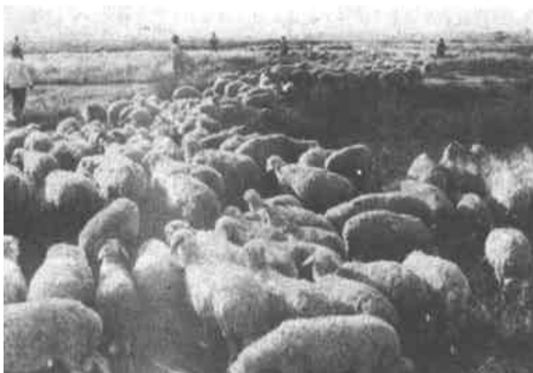
△ 黄河三角洲水草丰茂，为我市发展畜牧业生产提供了优越条件。目前，全市各种类型的畜牧业重点户、专业户已达2742个。垦利县新安乡新林村人均养羊13只，仅养羊一项人均年收入超千元，跨入全国畜牧业先进行列。图为新林村放牧的羊群。